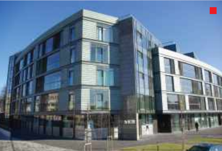
UAB „Vilmestos statyba“ – rangovas